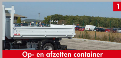
Op- en afzetten container