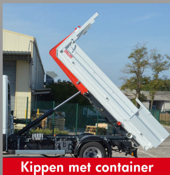
Kippen met container