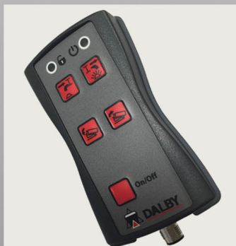
Bediening vanuit de cabine

De MINOX BRX haaksystemen voelen zich thuis in de meest uiteenlopende vakgebieden in de bouw- en de transportsector.